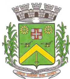
TABELA ANEXA AO DECRETO Nº 3.855/2008